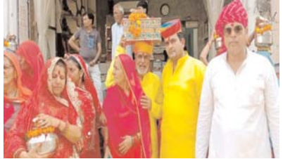
कलश धारण कर यात्रा की शोभा बढ़ाई। वहीं मुख्य यजमान श्रीमद्भागवत महापुराण की पोथी

शिवाड़। शुभशुभ ज्योतिर्लिंग महादेव मंदिर परिसर में शनिवार से श्रीमद्भागवत कथा का शुभारंभ श्रद्धा और उत्साह के साथ हुआ। कथा आरंभ से पहले कल्याण मंदिर से भव्य शोभायात्रा निकाली गई, जिसमें बड़ी संख्या में श्रद्धालु शामिल हुए। शोभायात्रा में बैंड-बाजों की मधुर धुनों पर महिला-पुरुष भगवान के भजनों पर नाचते-गाते नजर आए। महिलाओं ने सिर पर मंगल