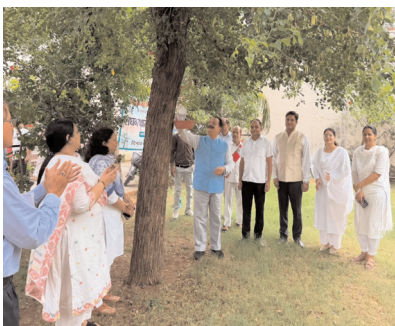
कम करने एवं आधिकारिक पौधारोपण की शपथ