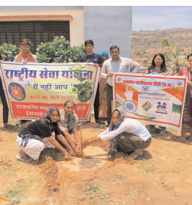
करीब एक हजार पौधे लगाए और सिंचाई के लिए पूरे परिसर में पाइपलाइन व्यवस्था करवाई। राष्ट्रीय सेवा योजना (एनएसएस) इकाई, सकार्य सदस्यों, विद्यार्थियों