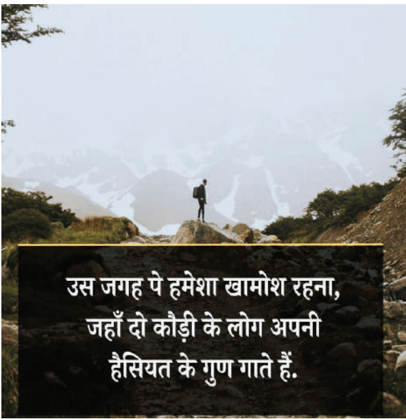
उस जगह पे हमेशा खामोश रहना, जहाँ दो कौड़ी के लोग अपनी हैसियत के गुण गाते हैं.

अनियोजित शहर नगरीय जीवन को केवल कष्टकारी ही नहीं बनाते, बल्कि वे विकास में बाधक भी बनते हैं। आज के युग में शहर आर्थिक विकास के इंजन हैं, लेकिन तभी, जब उनका नियोजित ढंग से विकास हो। बिगड़ना यह है कि जिन नगर निकायों की पहली जिम्मेदारी शहरों के नियोजित विकास को सुनिश्चित करना है, वे उसका ही निर्वहन करने में बुरी तरह नाकाम हैं। यदि शहरों की सूरत संवारी है और उन्हें विकास का वाहक बनाना है तो स्थानीय निकायों के कामकाज के तौर-तरीकों को पूरी तरह बदलना होगा।